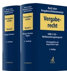
› Beck'scher Vergaberechtskommentar