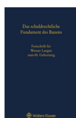
› Das schuldrechtliche Fundament des Bauens - Festschrift für Werner Langen zum 65. Geburtstag