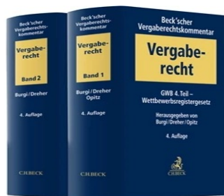
> Beck'scher Vergaberechtskommentar