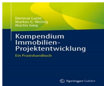
> Kompendium Immobilien-Projektentwicklung