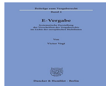
> E-Vergabe - Systematische Darstellung der Vorschriften des Vergaberechts im Lichte der europäischen Richtlinien