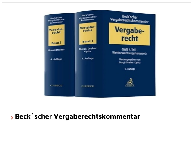
▸ Beck'scher Vergaberechtskommentar