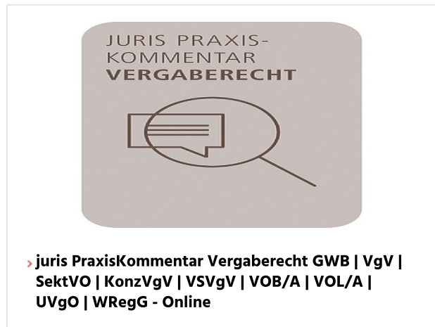
▸ juris PraxisKommentar Vergaberecht GWB | VgV | SektVO | KonzVgV | VSVgV | VOB/A | VOL/A | UVgO | WRegG - Online